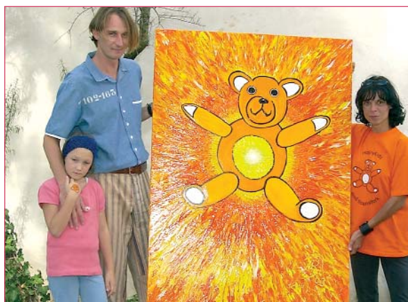
Übergabe des von Maler Martin Bratusa gefertigten HAPPY KIDS – Unikates

Zum Gelingen des Festes vor Ort trug nahezu die gesamte Diensthundeabteilung samt Familien bei.