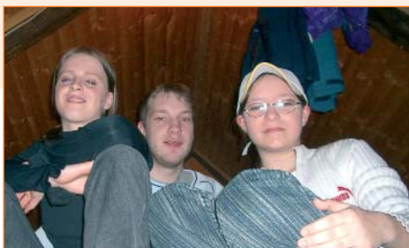
Entspannung im »Warmen«