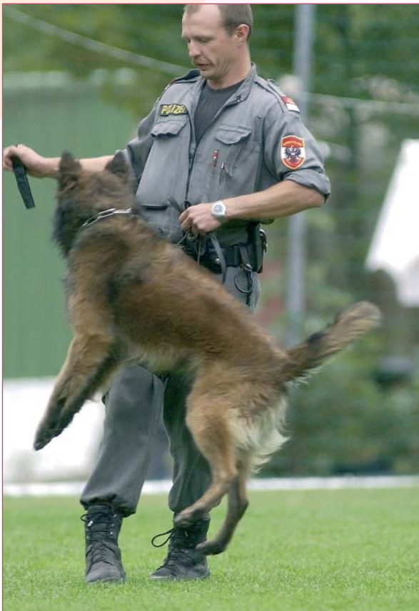
TEXT : HAPPY KIDS