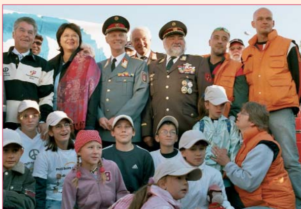
Bundespräsident Fischer verabschiedet die Teilnehmer zur Friedensflotte

Die Friedensflotte war ein wertvolles Projekt für HAPPY KIDS. In diesen Projektwochen konnten die Ziele von HAPPY KIDS aktiv mit den Kindern und Jugendlichen trainiert und gelebt werden.