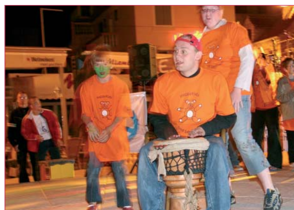
HAPPY KIDS-Beitrag beim Abschlussfest 2005