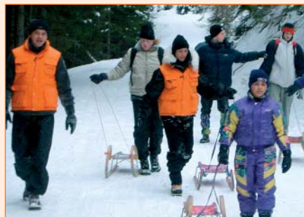
Aktivitäten im »Kalten«