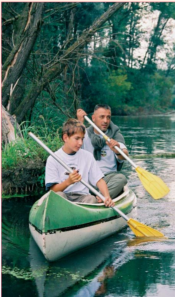
2004 Langenschönbichl Erkundung der Natur mittels Paddel