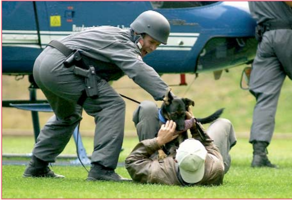
Nachwuchswelpe überwältigt direkt aus dem Hubschrauber einen Verbrecher