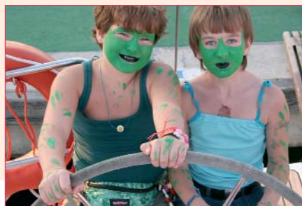
Quaxi & Co